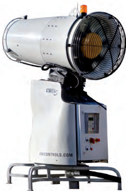
Model V12so to urządzenie opracowane specjalnie do zwalczania odorów. Jest wyposażone w dyszę wytwarzającą drobną mgłę, rozpraszaną na dużym obszarze przez wydajną turbinę. Nieprzyjemne zapachy są neutralizowane za pomocą precyzyjnie dozowanej substancji biologicznej. Zasięg projekcji wynosi 50 m, dzięki czemu urządzenie znakomicie nadaje się zarówno do mniejszych, jak i dużych obiektów. Jest obsługiwane za pomocą panelu sterującego lub pilota.